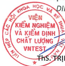
Ths. TRỊNH CÔNG SƠN